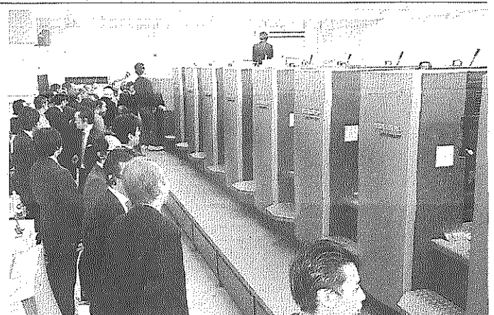
油性インキでの速乾印刷の可能性を示した

ともなう人件費などを最適 化することによるコスト削 減を模索しており、書籍の 需要と供給のマッチング・ 在庫・廃棄量の削減を図る ために、小ロット化と短納 期化を図れるデジタル印刷 の活用を志向していると説 明した。その上で、オフセ ット印刷とデジタル印刷の 製造損益分岐点として、モ ノクロで2000部、カラ ーで1500部という実例 に基づいた目安を提示しな がら、出版印刷におけるデ ジタル印刷の海外の活用事 例を紹介した。